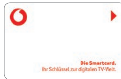
Kabel Anschluss Wohnung Digital

Die Verteilung der Programme zu den Anschlussdosen in den Wohnungen erfolgt über moderne und leistungsfähige Sternnetze, die wir für Sie komplett installieren.