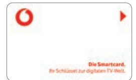
Kabel Anschluss Wohnung Express Digital